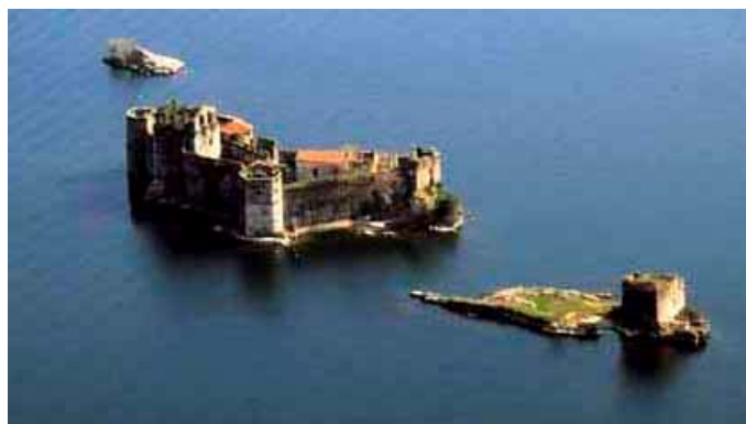
Lago Maggiore: i castelli di Cannero, nell'alto lago.