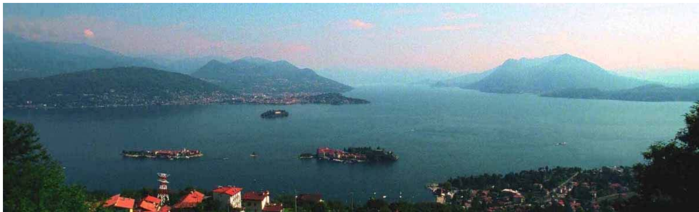
Lago Maggiore: il centro lago, con le Isole Borromeo.

Molti paesaggi "sensibili" caratterizzano i territori del Novarese e del Verbano-Cusio-Ossola, paesaggi emblematici di un'area che va dalla pianura della monocultura risicola, con il primaverile e spettacolare "mare a quadretti" delle risaie allagate, alle morbide elevazioni collinari rivestite di vigneti come per uno scampolo di Monferrato, ai laghi prealpini di raccolta, armoniosa bellezza (l'Orta) o di superbo incanto (il Maggiore), alle amene vallate e ai severi ambienti alpini coronati dalle vette che culminano nel Monte Rosa.