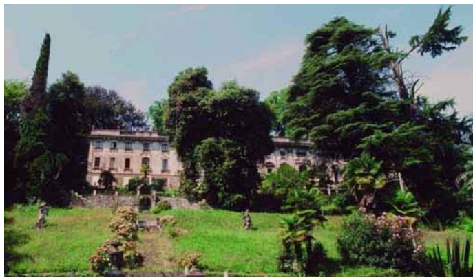
Lago Maggiore: la villa Cavallini a Solcio di Lesa.

Aderendo alla giornata nazionale indetta dalla propria associazione per evidenziare il valore dei paesaggi italiani e ribadire il dettato dell'art. 9 della Costituzione Italiana, le sezioni di Italia Nostra di Novara e del Verbano Cusio Ossola puntano l'attenzione, mediante il convegno di studio promosso con la collaborazione del Consiglio interregionale Piemonte-Valle d'Aosta, sul paesaggio del Verbano, scelto per la sua rilevante dimensione, per la sua complessità e per la precarietà della sua sopravvivenza.