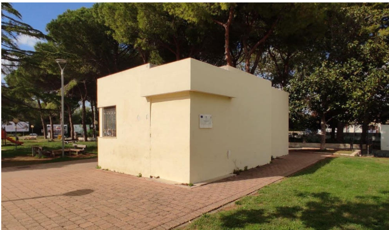
I e 2 - Parabita, vedute attuali del chiosco-bar del parco comunale "Aldo Moro".