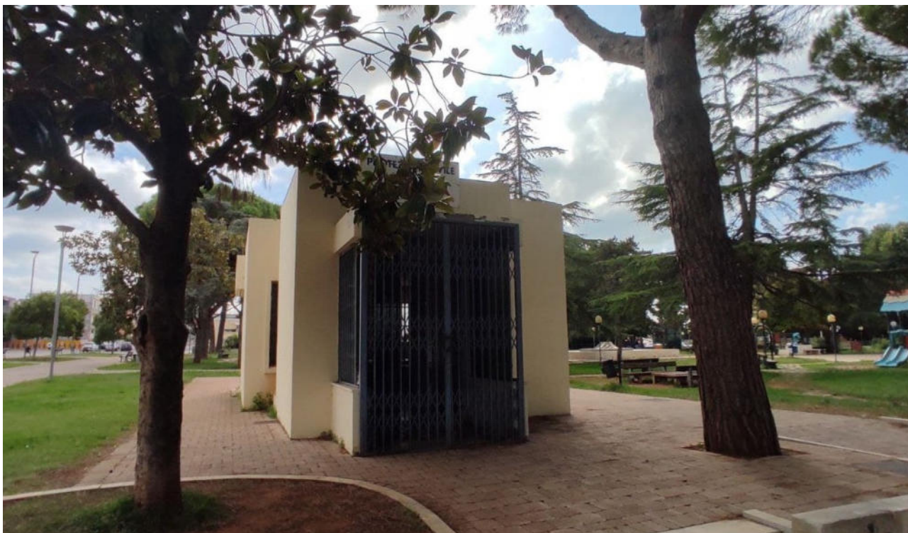
3 e 4 - Parabita, vedute attuali del chiosco-bar del parco comunale "Aldo Moro".