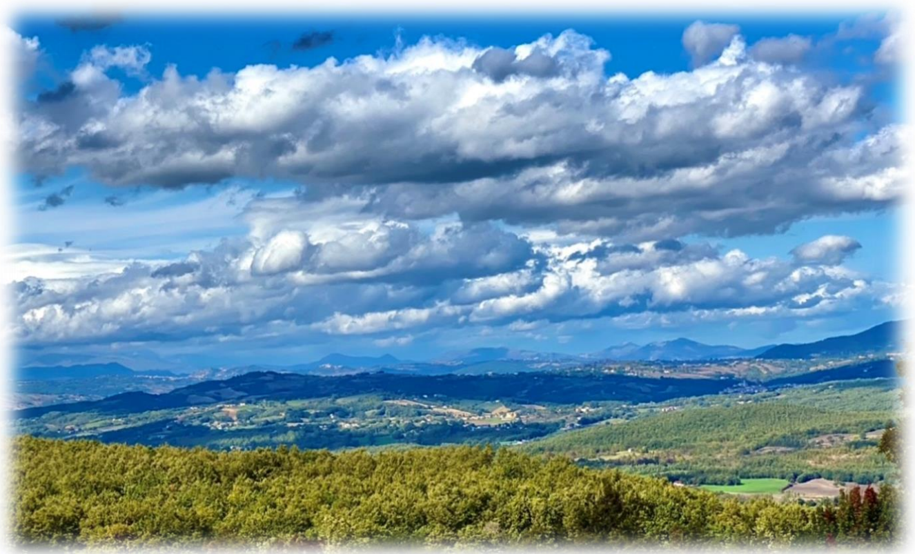
Foto ottobre 2020. Panorama lungo la strada per il Conventino.