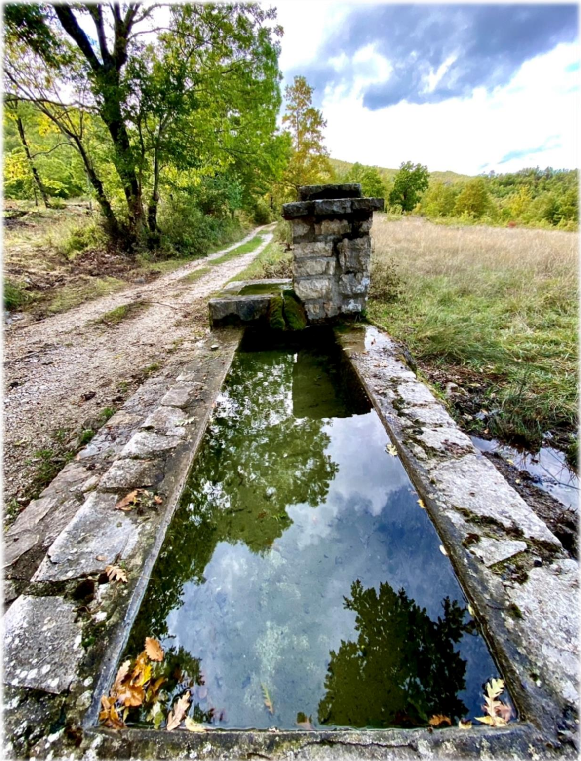
Foto dell'ottobre 2020. Fontana lungo la strada per il Conventino.

Per arrivare al Conventino, con un percorso a piedi di neanche 30 minuti, si possono ammirare paesaggi incontaminati e opere della mano dell'uomo.