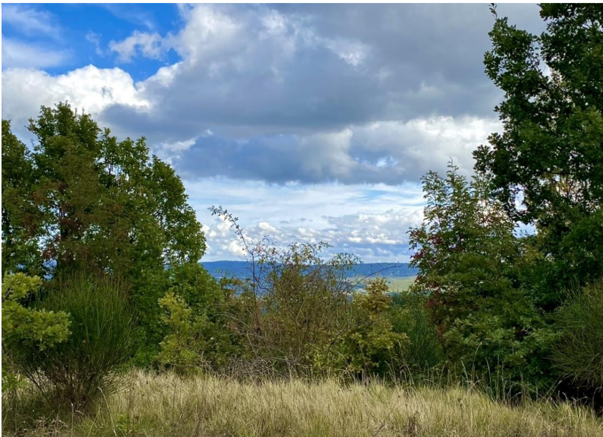
Foto ottobre 2020. Visuale verso sud-est, ostruita dalla vegetazione spontanea cresciuta davanti al piazzale del Conventino.

E poi quello storico, quando «...L'attrazione principale per il Conventino si ebbe ogni anno la vigilia ed il giorno del 2 agosto , quando gente proveniente da Sepino e paesi limitrofi bivaccava nella zona con vero stile penitenziale per l'acquisto dell'indulgenza della Porziuncola.» (da un articolo di Frate Agostino Campanozzi intitolato «Conoscere la storia»).