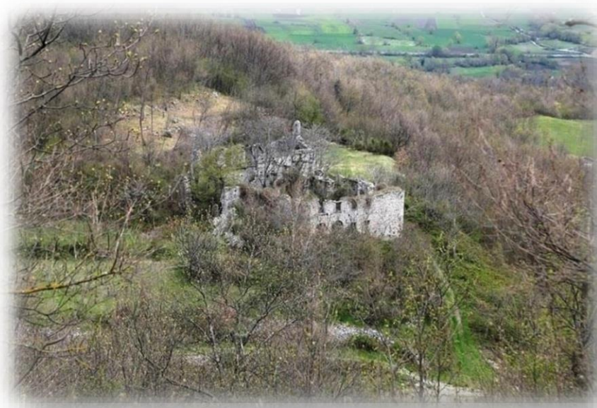
Foto del Conventino visto dall'alto (anno 2009)

Localizzazione da Google Earth. Il percorso in automobile (tratteggiato in rosso) consente in pochi minuti di avvicinarsi in automobile dal paese di Sepino al luogo dove sorgeva il Conventino. Lasciata l'auto, si procede a piedi su strada bianca per 20/30 minuti.