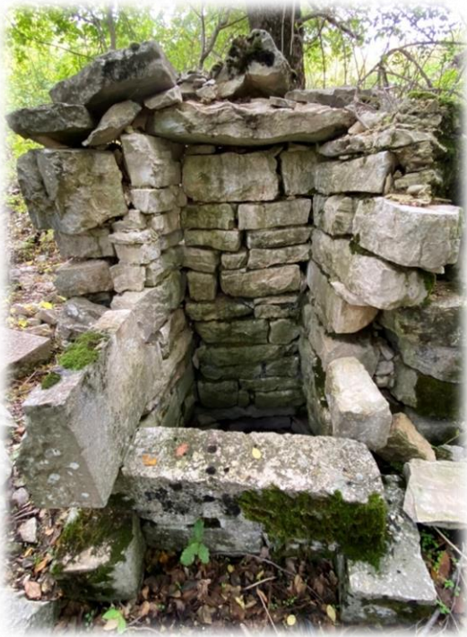
Foto dell'ottobre 2020. Pozzo del Conventino all'esterno.

Intorno al Conventino si estende molto terreno agricolo, che una volta era visibilmente coltivato e che era dotato di un bel pozzo, che tuttora si può pericolosamente ammirare....