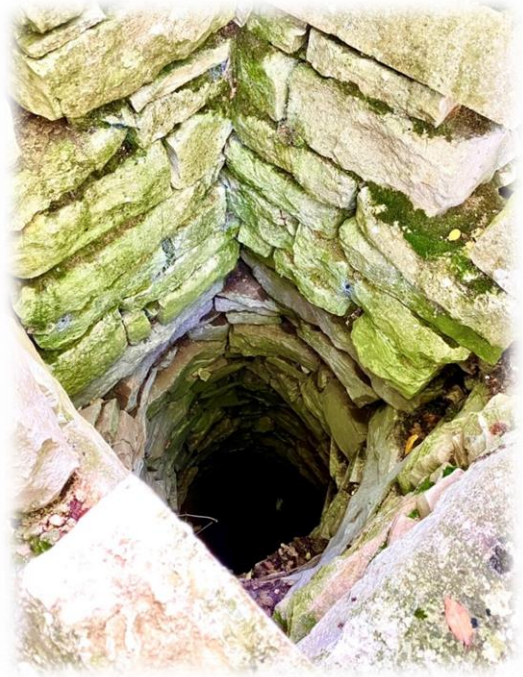
Foto ottobre 2020. Interno del pozzo del Conventino.