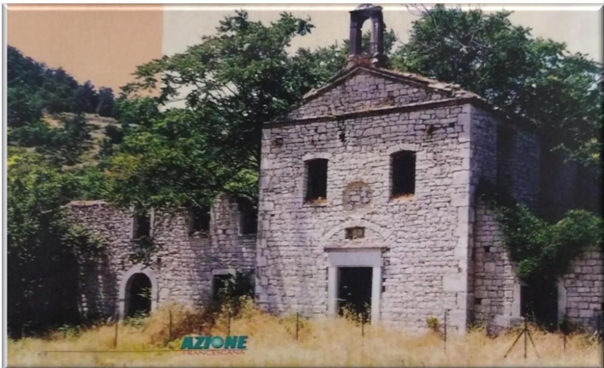
Foto tratta dalla rivista «Azione Francescana» - n.2 di giugno 2009

(fonte “Il Conventino di Santa Maria degli Angeli in Sepino”, Tipografia della Porziuncola, 1896).