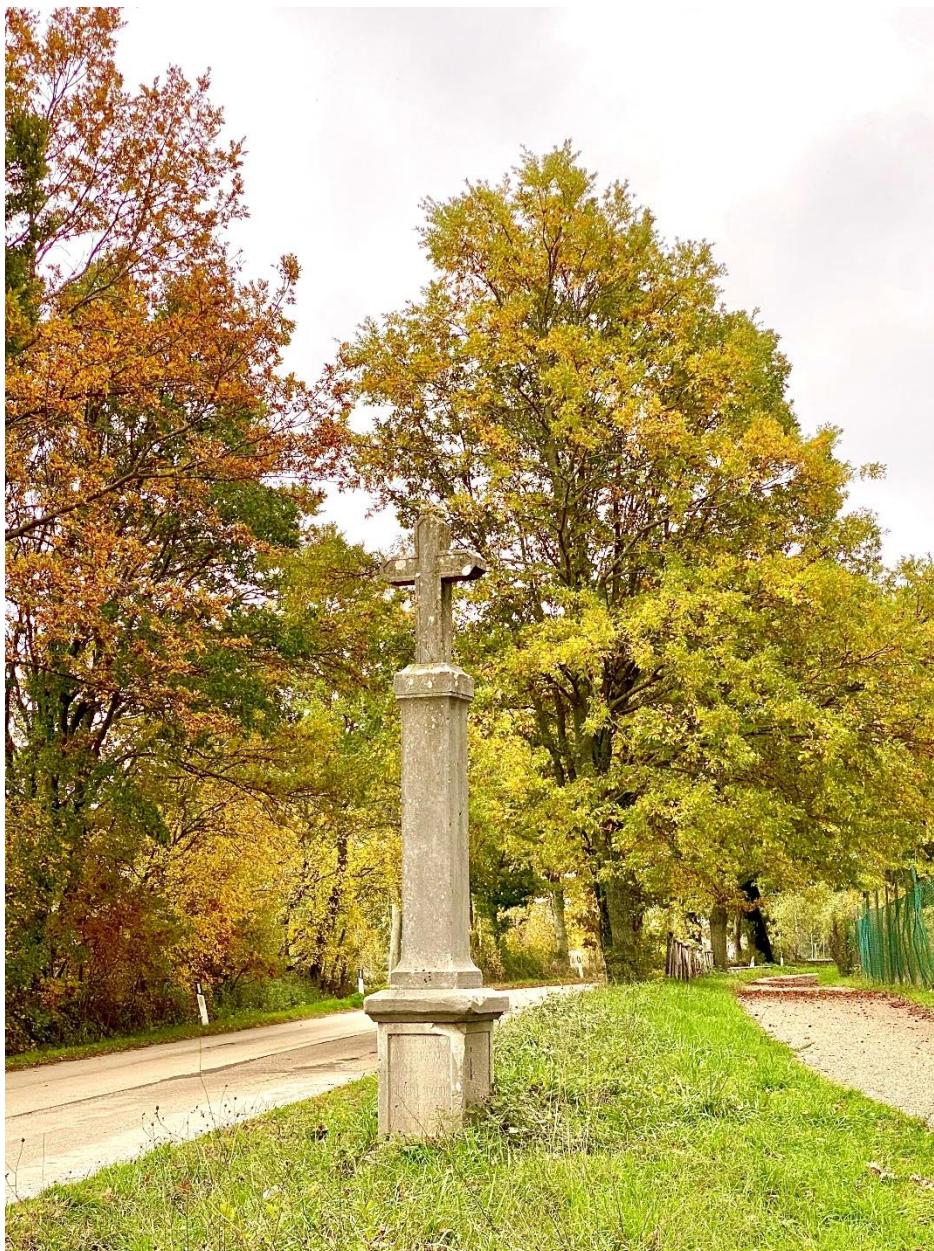
Foto del novembre 2021. Croce viaria dedicata a Nicola Maglieri, alberata e pista ciclabile.

«Istituzione dell'elenco degli alberi monumentali d'Italia e principi e criteri direttivi per il loro censimento» del MINISTERO DELLE POLITICHE AGRICOLE ALIMENTARI E FORESTALI di concerto con il MINISTRO DEI BENI E DELLE ATTIVITÀ CULTURALI E DEL TURISMO e il MINISTRO DELL'AMBIENTE E DELLA TUTELA DEL TERRITORIO E DEL MARE, all'art. 5. stabilisce i «Criteri di monumentalità» ed al punto f) quello di pregio paesaggistico: «...considera l'albero come possibile elemento distintivo, punto di riferimento, motivo di toponomastica ed elemento di continuità storica di un luogo. Trattasi di un criterio di sintesi dei precedenti, essendo il paesaggio, per sua definizione, costituito da diverse componenti: quella naturale, quella antropologico culturale e quella percettiva. Il criterio di cui alla presente lettera è verificato e valutato d'intesa con la Soprintendenza territorialmente competente del Ministero dei beni e delle attività culturali e del turismo...».