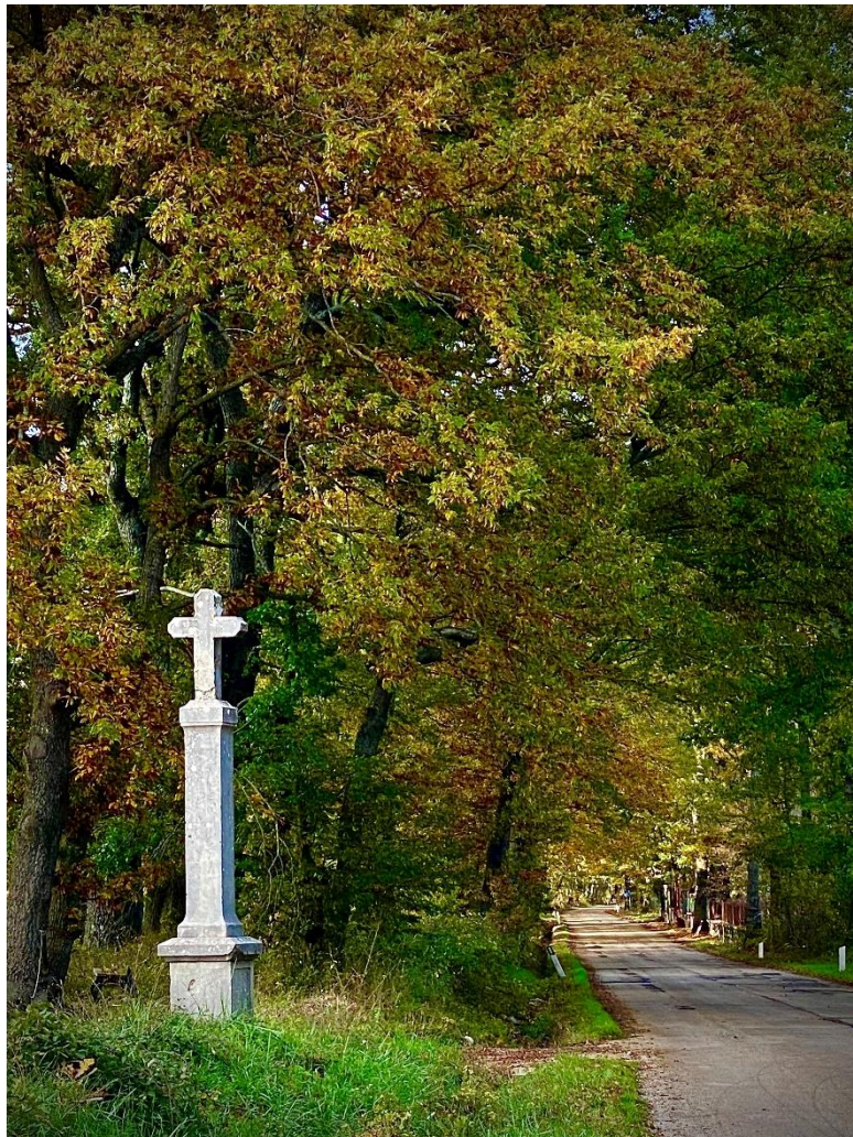
Foto di ottobre 2021. L'alberata di roverelle su un tratto della Strada Provinciale 82.

«Norme per lo sviluppo degli spazi verdi urbani», pubblicata sulla G.U. n-27 del giorno 1/2/2013, all'art.7 prevede delle «Disposizioni per la tutela e la salvaguardia degli alberi monumentali, dei filari e delle alberate di particolare pregio paesaggistico, naturalistico, monumentale, storico e culturale» e stabilisce cosa si intende per «albero monumentale» trattando al punto b) il tema dei filari e delle alberate «di particolare pregio paesaggistico, monumentale, storico e culturale ivi compresi quelli inseriti nei centri urbani».