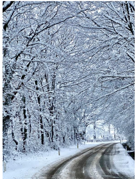
Foto del febbraio 2021. Alberata di querce da Sepino a Saepinum.