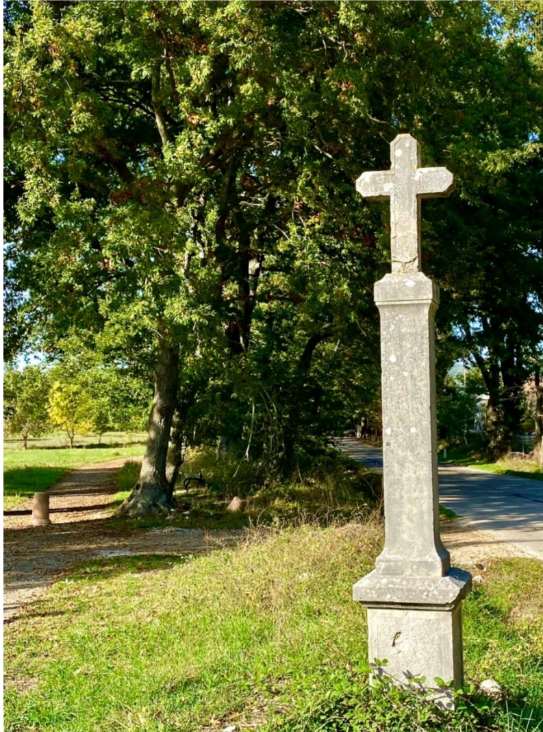
Foto di ottobre 2021, nella quale è inquadrata la croce viaria. Alla sua sinistra la pista ciclabile, mentre a destra si delinea l'alberata di roverelle.

La Croce viaria, in pietra calcarea locale, dedicata a Nicola Maglieri e l'alberata di roverelle che conduce dal paese di Sepino agli scavi archeologici di Saepinum .