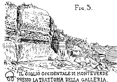
IL CIGLIO OCCIDENTALE DI MONTEVERDE PRESSO LA TRATTORIA DELLA GALLERIA.

A, argille; S, sabbie; C, puddinga; G, Terreno ghiaioso sabbioso; T, Tufi antichi; t, Tufi recenti; F, Frane; *, Sorgente; o, Pozzo