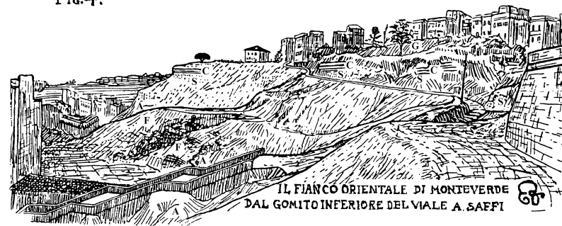
IL FIANCO ORIENTALE DI MONTEVERDE DAL GOMITO INFERIORE DEL VIALE A. SAFFI