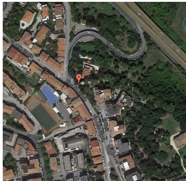
LA SEDE DELLA BIBLIOTECA PRESSO VILLA BEER - ANCONA