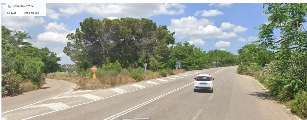
9-10-11- pini nell'aiuola Nord lungo la SP361 km17,900 innesto per SP51, foto GoogleMaps giugno 2023.