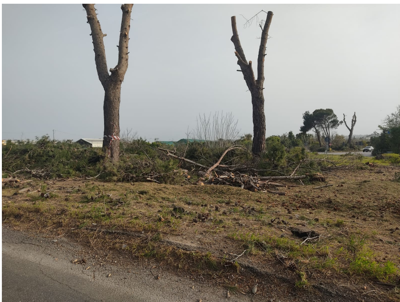
4 e 5- pini nell'aiuola nord lungo la SP361 km17,900 innesto per SP51, fotografia del 1.4.2024.