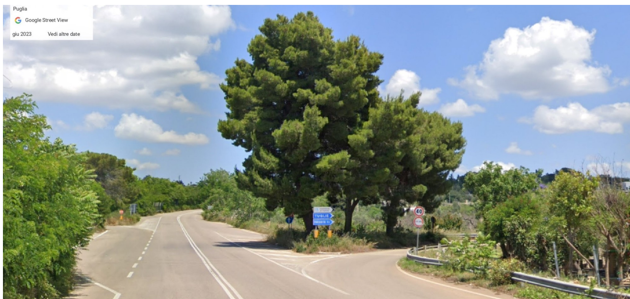
6-7-8- pini nell'aiuola Sud lungo la SP361 km17,900 innesto per SP51, foto GoogleMaps giugno 2023.