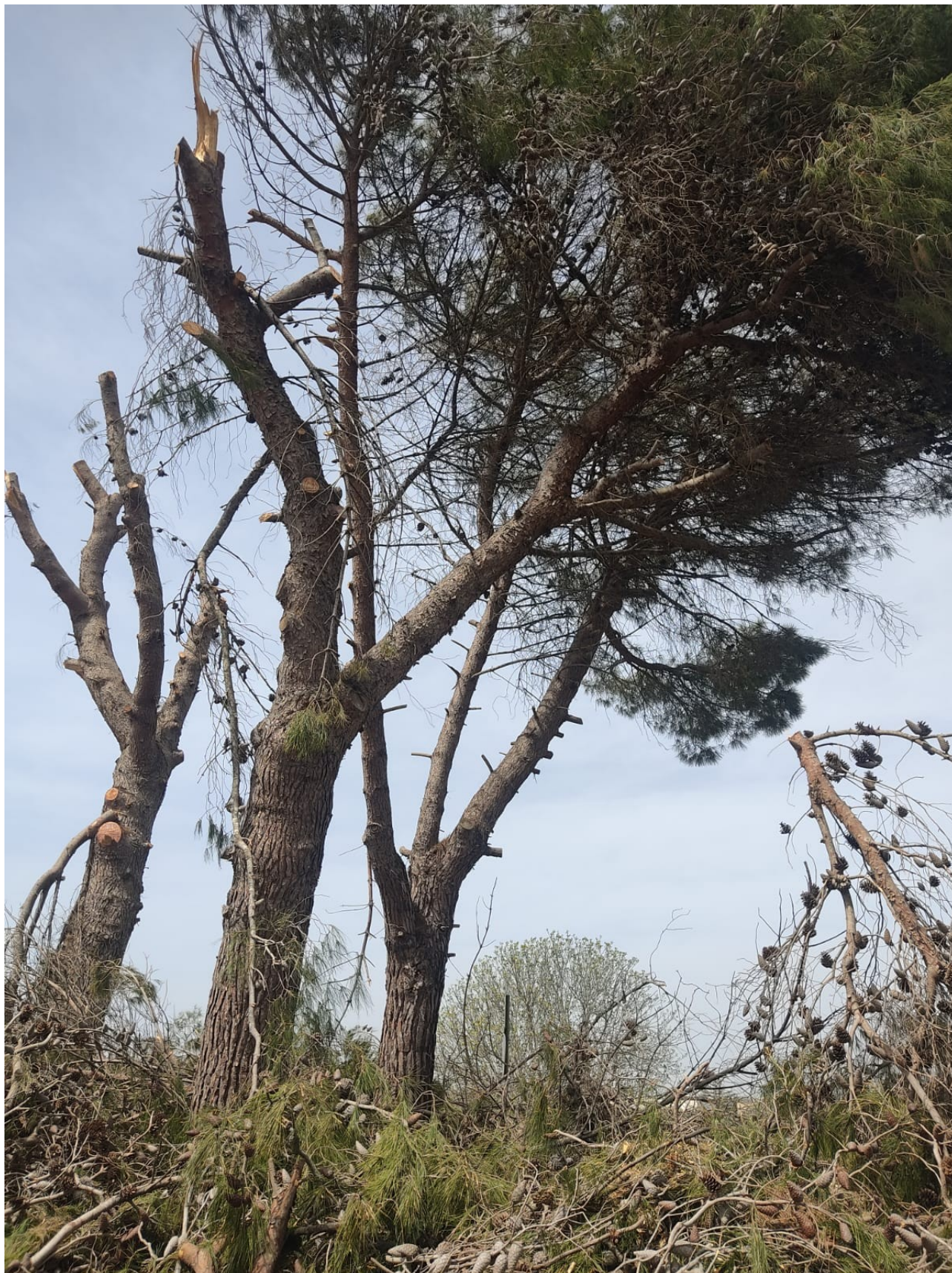
2- pini nell'aiuola sud lungo la SP361 km17,900 innesto per SP51, fotografia del 1.4.2024.

segue nota del 1.4.2024 ad oggetto: Abbattimento in territorio di Parabita di diversi alberi di pino presenti sulla S.P. 361 al km.17,900 agli innesti con SP51. Considerazioni e richiesta di informazioni.