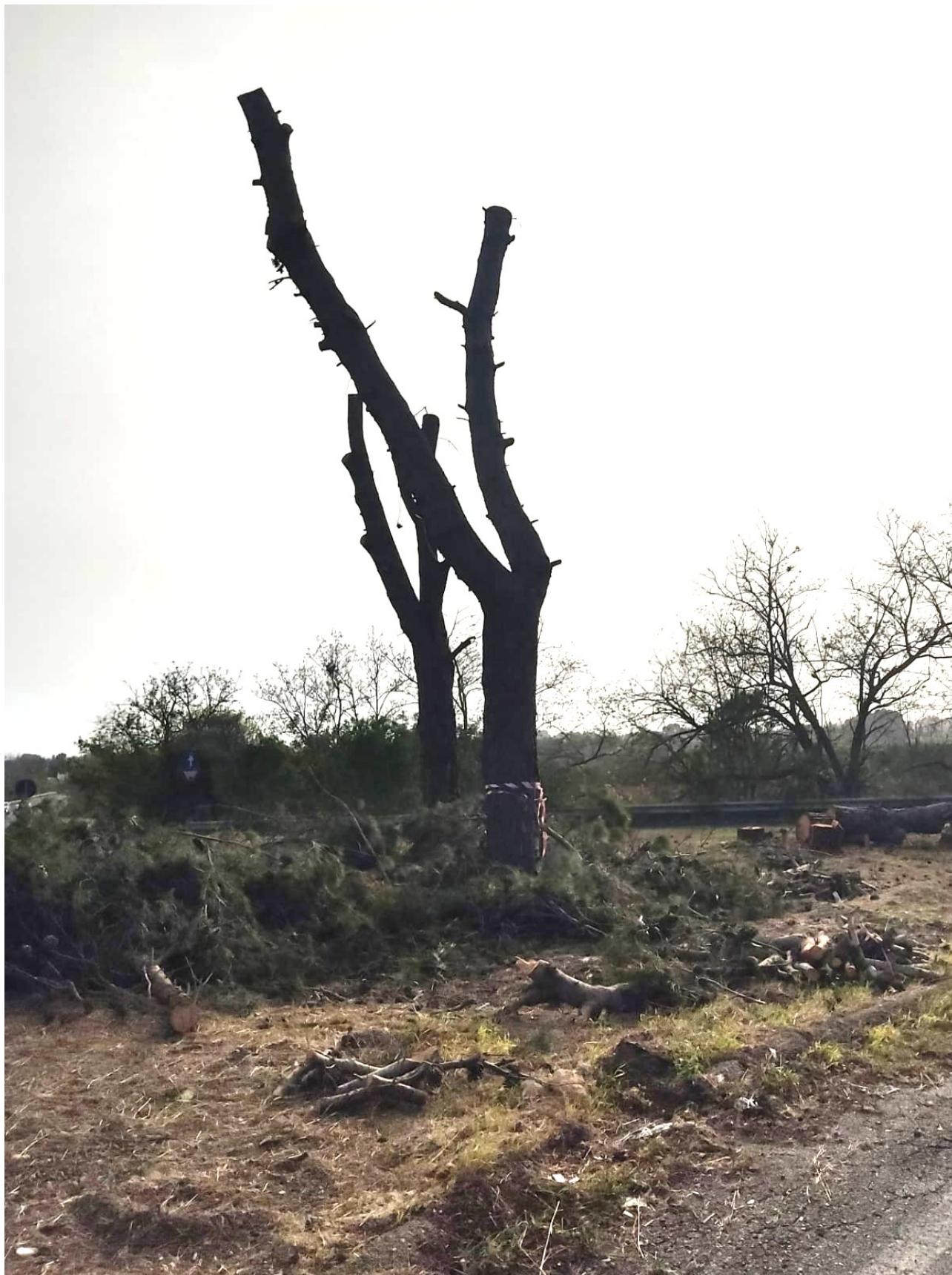
3- pini nell'aiuola nord lungo la SP361 km17,900 innesto per SP51, fotografia del 1.4.2024.

segue nota del 1.4.2024 ad oggetto: Abbattimento in territorio di Parabita di diversi alberi di pino presenti sulla S.P. 361 al km.17,900 agli innesti con SP51. Considerazioni e richiesta di informazioni.