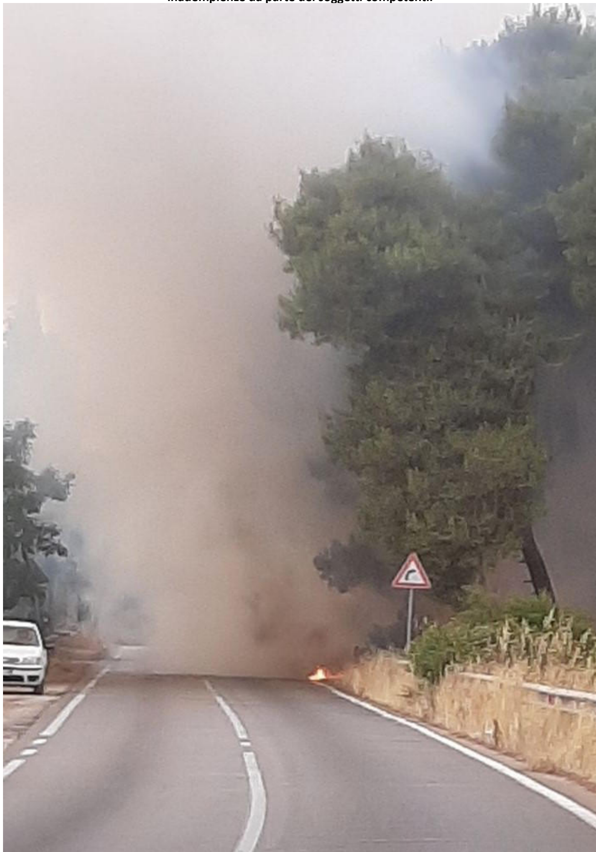
Incendio della pineta di Suepersanodel 17.7.2021, foto pubblicata il 17.7.2021 ore 17:15 sulla pagina facebook della Protezione civile Salento al link https://www.facebook.com/protezionecivilesalento/photos/pcb.2554254684882754/2554254624882760

segue nota del 20.7.2021 ad oggetto: Incendio sul costone della pineta della Serra di Supersano sul tratto della S.P.n.174. Rimostranze per il mancato riscontro della nota del 02 luglio u.s. e per le eventuali inadempienze da parte dei soggetti competenti.