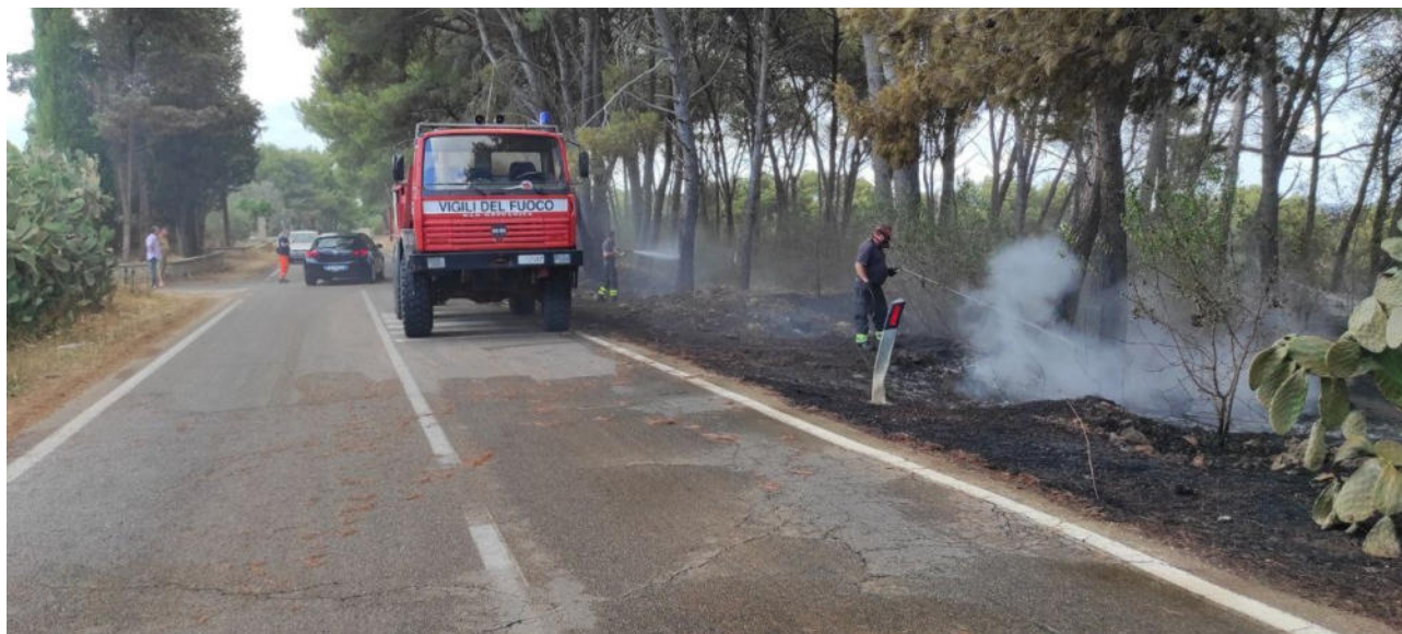
Incendio della pineta di Supersano del 17.7.2021, foto pubblicata il 17.7.2021 ore 17:15 sulla pagina facebook della Protezione civile Salento al link https://www.facebook.com/protezionecivilesalento/photos/pcb.2554254684882754/2554254384882784

segue nota del 20.7.2021 ad oggetto: Incendio sul costone della pineta della Serra di Supersano sul tratto della S.P.n.174. Rimostranze per il mancato riscontro della nota del 02 luglio u.s. e per le eventuali inadempienze da parte dei soggetti competenti.