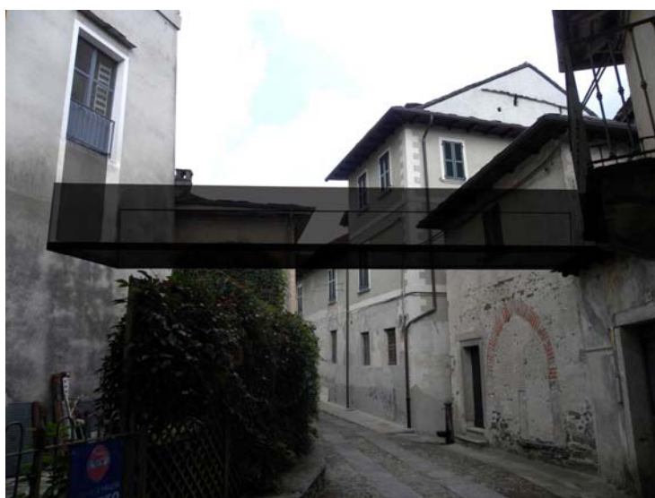
Lago d'Orta (Provincia di Novara), Isola di San Giulio. Il tratto di Via alla Basilica (visto da sud) in cui si sta costruendo il ponte a scavallo della stradina..