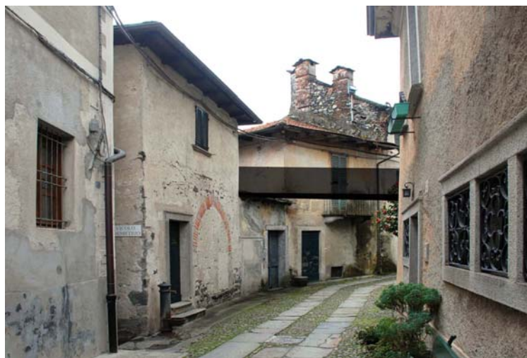
Lago d'Orta (Provincia di Novara), Isola di San Giulio. Il tratto di Via alla Basilica (visto da nord) in cui si sta costruendo il ponte a scavallo della stradina.