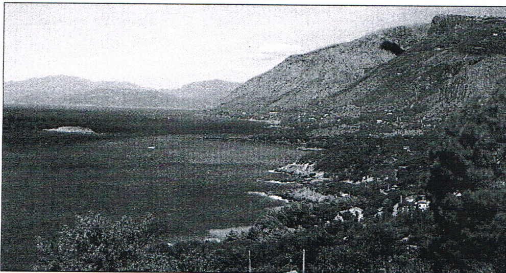
La costa marateota oggetto dei “desideri”