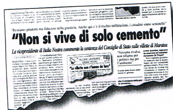
Un titolo della Nuova del 7 febbraio e la determina regionale del 19 luglio 2011