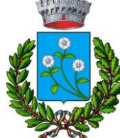
Roseto Capo S.