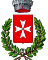
S. Giovanni di Gerace