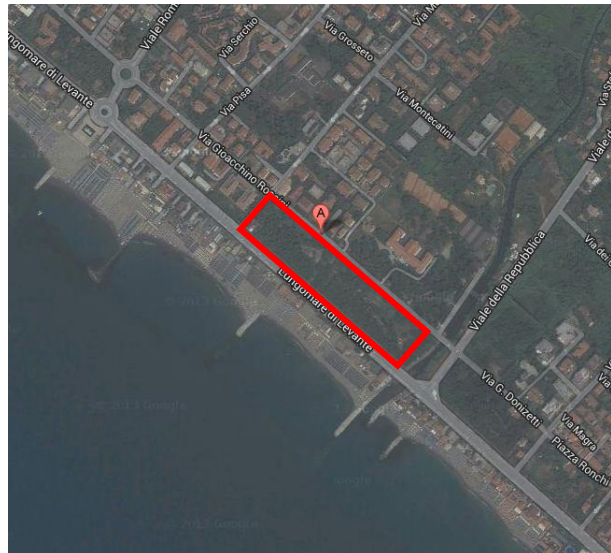
PARCO DEL MAGLIANO - Massa (Google Maps - Satellite)

Il Parco è costituito dall'area compresa tra Via Rossini, Via Magliano, il Lungomare di Levante e il Fosso del Magliano.