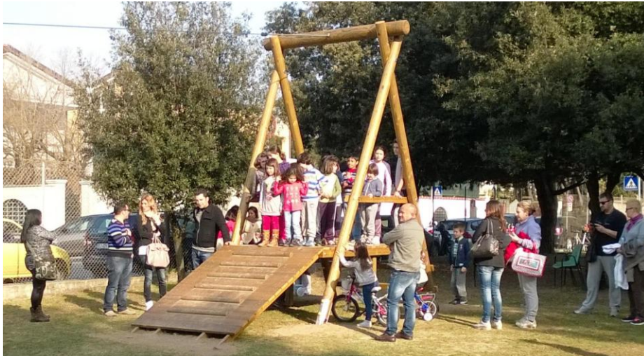
LA FUNIVIA-GIOCO INSTALLATA DA ITALIA NOSTRA NEL PARCO

Molte di queste proposte sono state realizzate, come anche la creazione di un'area botanica all'interno del Parco, grazie alla collaborazione con l'associazione onlus "Valentina Giumelli".