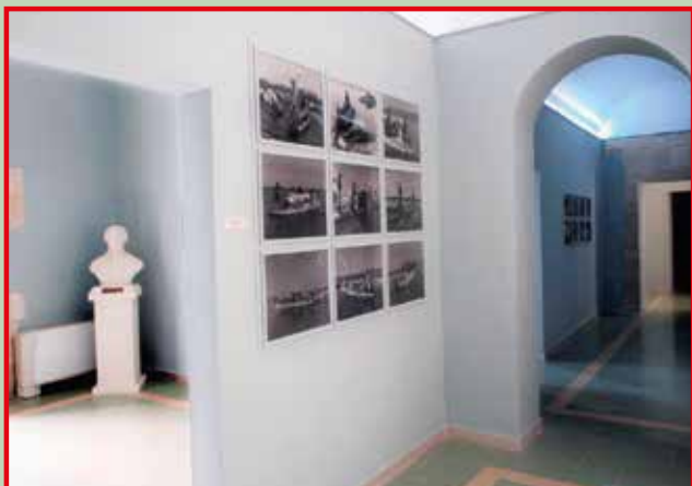
Museo del Papiro - Galleria

MUSEO del PAPIRO "Corrado Basile" – ex Convento di Sant'Agostino in Ortigia, Via Nizza, 14 - 96100 SIRACUSA - Istituito nel 1987 - Riconosciuto dal MiBAC