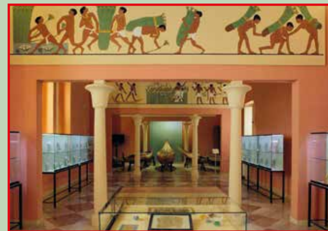
Museo del Papiro - Sala delle barche di papiro

Per gli incerti tempi dettati dalla pandemia, la manifestazione culturale annuale di ITALIA NOSTRA abbraccia un arco di tempo più lungo con " Le Settimane dei Beni Culturali 2021 ".