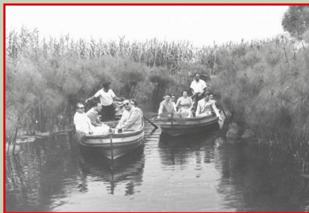
Siracusa - Navigazione lungo il fiume Ciane