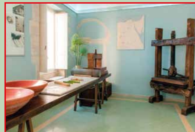
Museo del Papiro - Laboratorio per la fabbricazione della carta