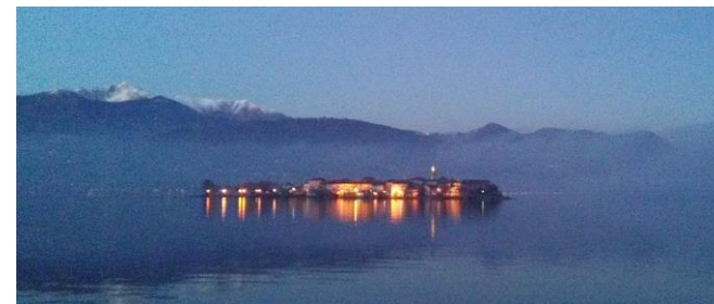
Lago Maggiore, Isola dei Pescatori