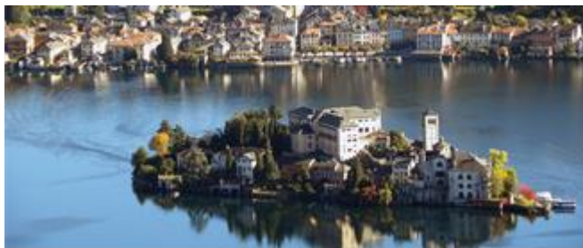
Lago d'Orta, Isola di San Giulio e Orta San Giulio