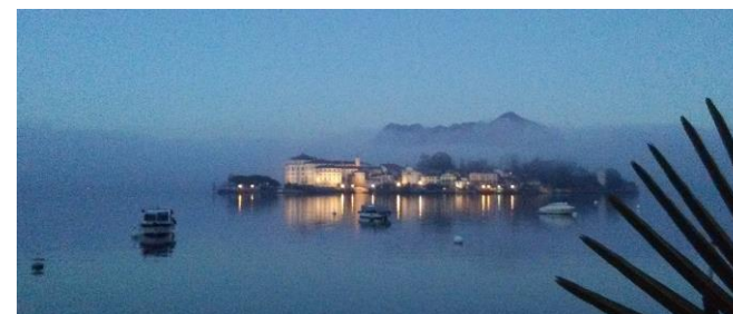
Lago Maggiore, Isola Bella