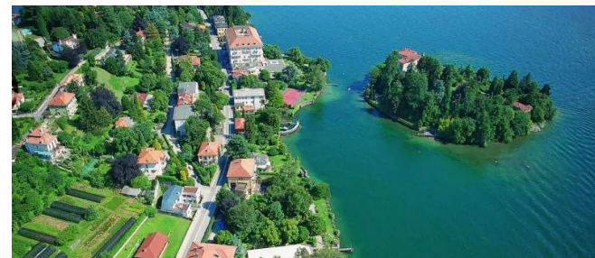
Lago Maggiore Isola di San Giovanni