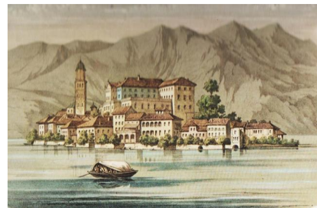
Lago d'Orta, l'isola di San Giulio in una litografia tedesca di metà Ottocento.